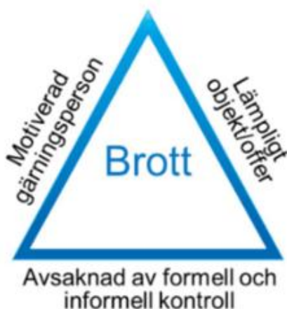
Figur 1. Brottstriangeln i dess grundform.

I brottstriangeln representerar varje enskild sida av triangeln en förutsättning för att brott skall begås. För att brott ska begås ska det finnas; 1. En motiverad gärningsperson, 2. Ett lämpligt objekt/offer, samt 3. Avsaknad av formell och informell kontroll som hindrar att brott begås. När dessa förutsättningar sammanstrålar ökar brottsligheten. Försvagas förutsättningarna minskar brottsligheten. För att förebygga brott skall således en, eller flera, av dessa förutsättningar angripas.