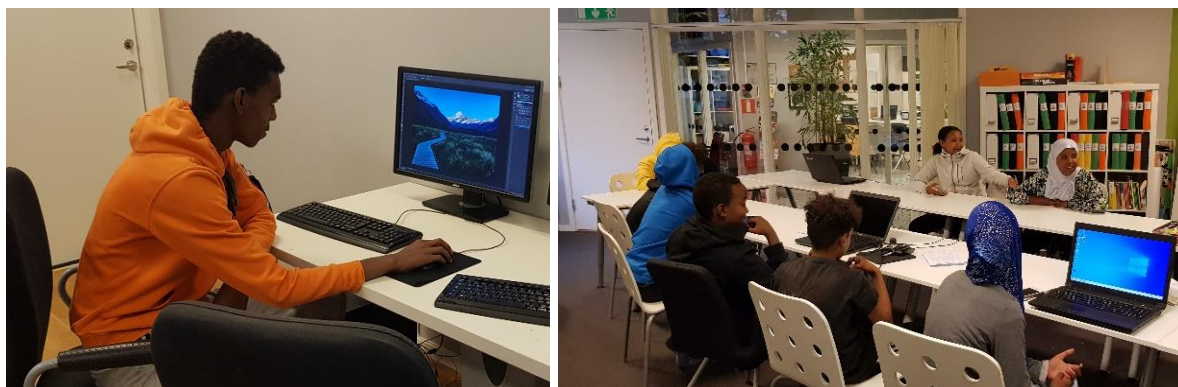
Aktivitet inom "Digital Design"

Under tidig höst så utökade vi även våra fokustider under tisdagar, onsdagar och torsdagar till kl. 21:00, (tidigare 20:00)