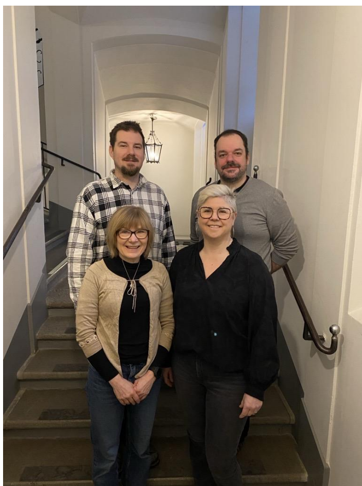
Figur 1 föreställer BIGs arbetsgrupp.

BIG är en del Gävle kommuns brottsförebyggande arbete.