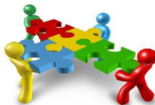
Figur 8 föreställer fyra tecknade figurer som håller i varsin pusselbit, vilken sitter ihop med de andras bitar.

BIG kommer att erbjuda en utbildning för skolpersonal som syftar till att stärka trygghet, tillit och samarbete i elevgrupper. Utbildningsdagen bygger på teori om grupp-utveckling och på praktiska övningar som kan användas i t.ex. klassrum, skolgård eller gymnastiksal.