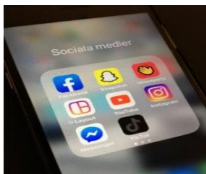
Figur 6 föreställer skärmen på en mobiltelefon med ett antal olika appar för sociala medier t.ex. Facebook, Snap Chat och Tiktok.