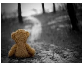
Figur 7 föreställer en nalle som sitter ensam på en lerig väg och tittar bort i fjärran.

BIG kommer i samverkan med socialtjänsten bjuda in personal från skola och förskola till utbildningen "Tala om oron". Utbildningen syftar till att ge redskap för hur man talar med vårdnadshavare när man känner oro för deras barn. Syftet är också att ge en fördjupad kunskap om anmälningsplikten och socialtjänstens stödinsatser.