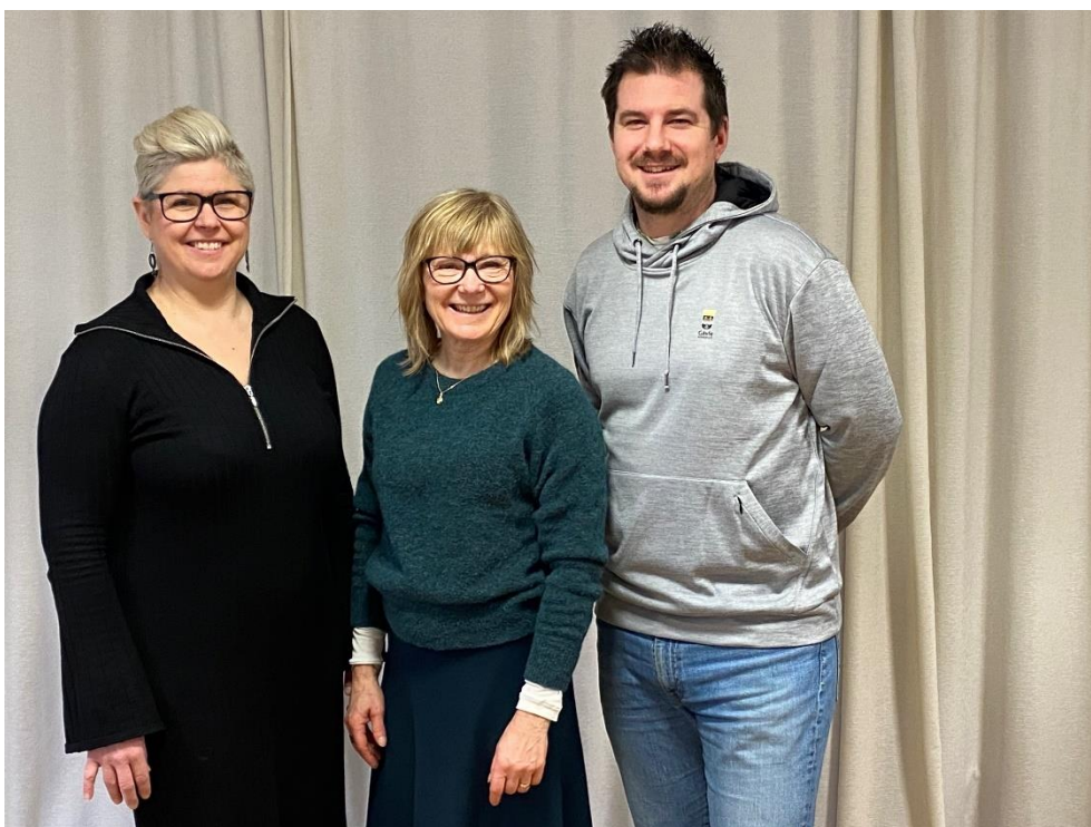
Figur 1 föreställer BIGs arbetsgrupp.

BIG är en del Gävle kommuns brottsförebyggande arbete.