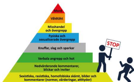
Figur 9 föreställer en våldspyramid, dvs en beskrivning av våldets olika delar och dess möjliga utveckling om ingen säger stopp.

Våld tar sig många uttryck och former, bland annat i form av kränkningar, jargong och skojbråk. Det börjar ofta med sådant som vi inte direkt uppfattar som våld utan som på grund av normer och förväntningar har normaliserats. Forskning visar att våld går att