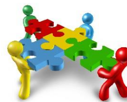
Figur 8 föreställer fyra tecknade figurer som håller i varsin pusselbit, vilken sitter ihop med de andras bitar.