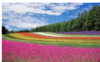
Figur 5 föreställer ett fält fullt av blommor i olika färger som ser ut som en regnbåge.

BIG erbjuder skolpersonal en utbildning som ger verktyg för hur man kan arbeta med främjande insatser och ett normkritiskt perspektiv i skolan.