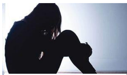
Figur 3 föreställer ett barn som sitter med ryggen mot en vägg med uppdragna knän och nedsänkt huvud.

Syftet med Gävlemodellen (GM) är att förena forskningsresultat med de krav som ställs på verksamheten i skollagen, diskrimineringslagen och läroplanen.