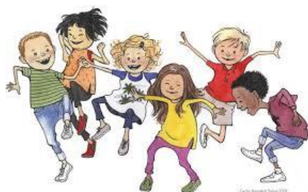
Figur 2 föreställer lekande, skrattande barn.

Det övergripande målet med trygghetsarbetet är att skapa trygga och goda lärandemiljöer. Tyngdpunkten ligger på främjande och förebyggande insatser. BIG fortsätter att stödja skolor och förskolor i deras arbete med att främja