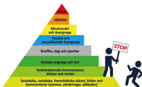
Figur 9 föreställer en våldspyramid, dvs en beskrivning av våldets olika delar och dess möjliga utveckling om ingen säger stopp.

Våld tar sig många uttryck och former, bland annat i form av kränkningar, jargong och skojbråk. Det börjar ofta med sådant som vi inte direkt uppfattar som våld utan som på grund av normer och förväntningar har normaliserats. Forskning visar att våld går att