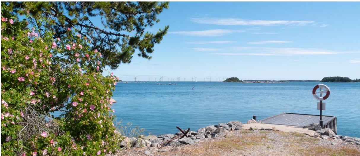
Visualisering av Vindpark Utposten 2 sedd från Trollharen, 32 verk, 350 meter. Visualisering genomförd av SWECO.