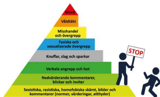
Figur 8 föreställer en våldspyramid, dvs en beskrivning av våldets olika delar och dess möjliga utveckling om ingen säger stopp.

Våld tar sig många uttryck och former, bland annat i form av kränkningar, jargong och skojbråk. Det börjar ofta med sådant som vi inte direkt uppfattar som våld utan som på grund av normer och förväntningar har normaliserats. Forskning visar att våld går att