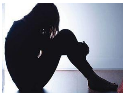
Figur 3 föreställer ett barn som sitter med ryggen mot en vägg med uppdragna knän och nedsänkt huvud.

Syftet med Gävlemodellen (GM) är att förena Skolverkets forskningsresultat som presenteras i rapporten ”Utvärdering av metoder mot mobbing”, med de krav som ställs på verksamheten i skollagen, diskrimineringslagen och läroplanen.