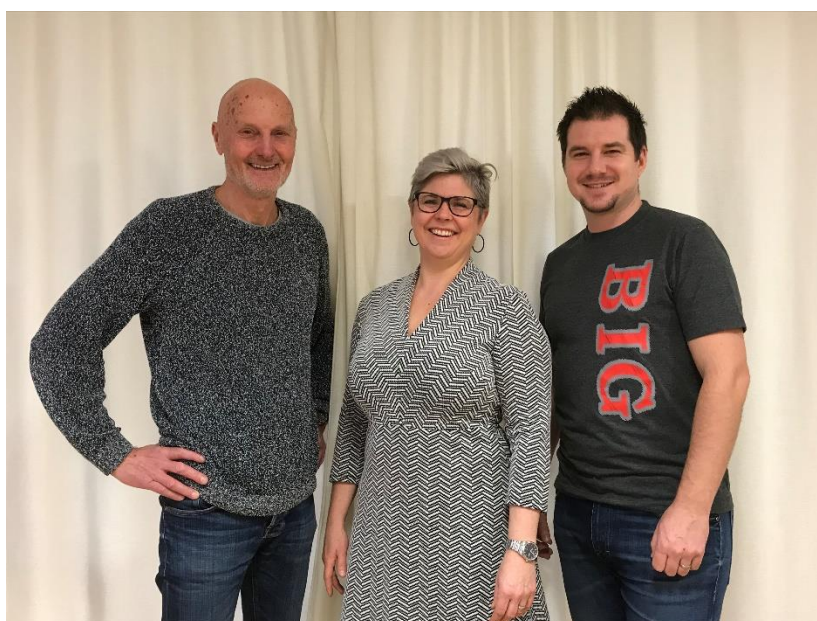
Figur 1 föreställer BIGs arbetsgrupp.

BIG är en del Gävle kommuns brottsförebyggande arbete.