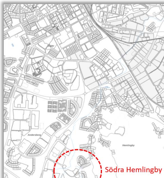
Översiktskarta för över Södra Gävle