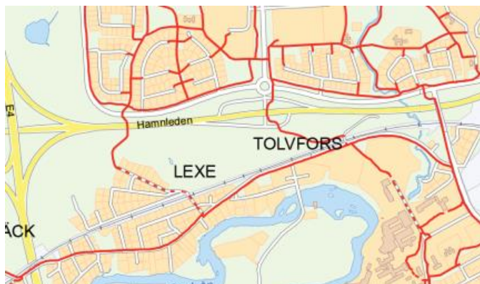
Befintliga cykelvägar (utdrag ur Kommunens cykelkarta)