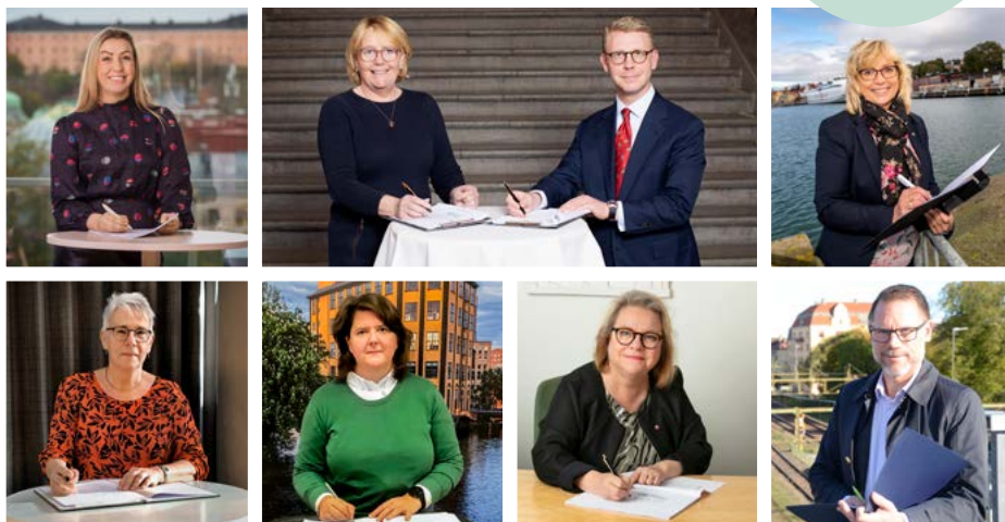
Systemanalys 2020 har fastställts och signerats av regionstyrelsens ordförande i de sju regionerna i Mälardalsrådets En Bättre Sits-samarbete.

Framtidens resor – Storregional systemanalys för Stockholm-Mälardalsregionen 2020 överlämnades till Trafikverket den 23 oktober. Överlämnandet gjordes ombord ett Mälartåg på Stockholms centralstation. I Systemanalysen har de sju regionerna i Mälardalsrådets En Bättre Sits-process kommit fram till gemensamma prioriteringar om vilka järnvägar, vägar och hamnar länen vill satsa på de kommande åren.