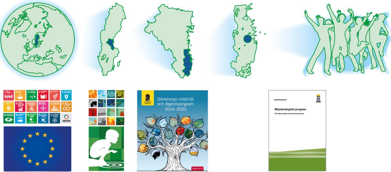
Figur 2. Styrande dokument från globalt till lokalt för Gävles miljöarbete.