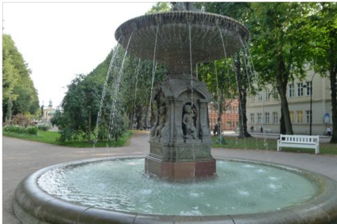
Gävle kommuns gymnasieskolor är populära utifrån sin kvalitet och centrala läge, den mest centralt placerade är Vasaskolan mitt i stan.

Skolan ska vara likvärdig och ge alla elever samma möjligheter till en bra utbildning. En likvärdig skola nås genom att varje elev ges de möjligheter hen behöver för att klara sin skolgång oavsett vilken skola de går i, oavsett var i Gävle de bor. När elever med olika bakgrund och livsåskådning möts förbättras inte bara resultaten utan också sammanhållningen. Därför vill vi att utbildningen i Gävle ska främja möten och motverka segregation.