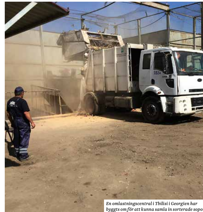
En omlastningscentral i Tbilisi i Georgien har byggts om för att kunna samla in sorterade sopor.

Gästrike återvinnare ligger i framkant inom avfallshantering, miljöfrågor och är framgångsrika inom kommunikation och beteendeförändring. Vår kompetens efterfrågas i hela världen och är något vi har arbetat med under många år ”för en värld som räcker längre”.