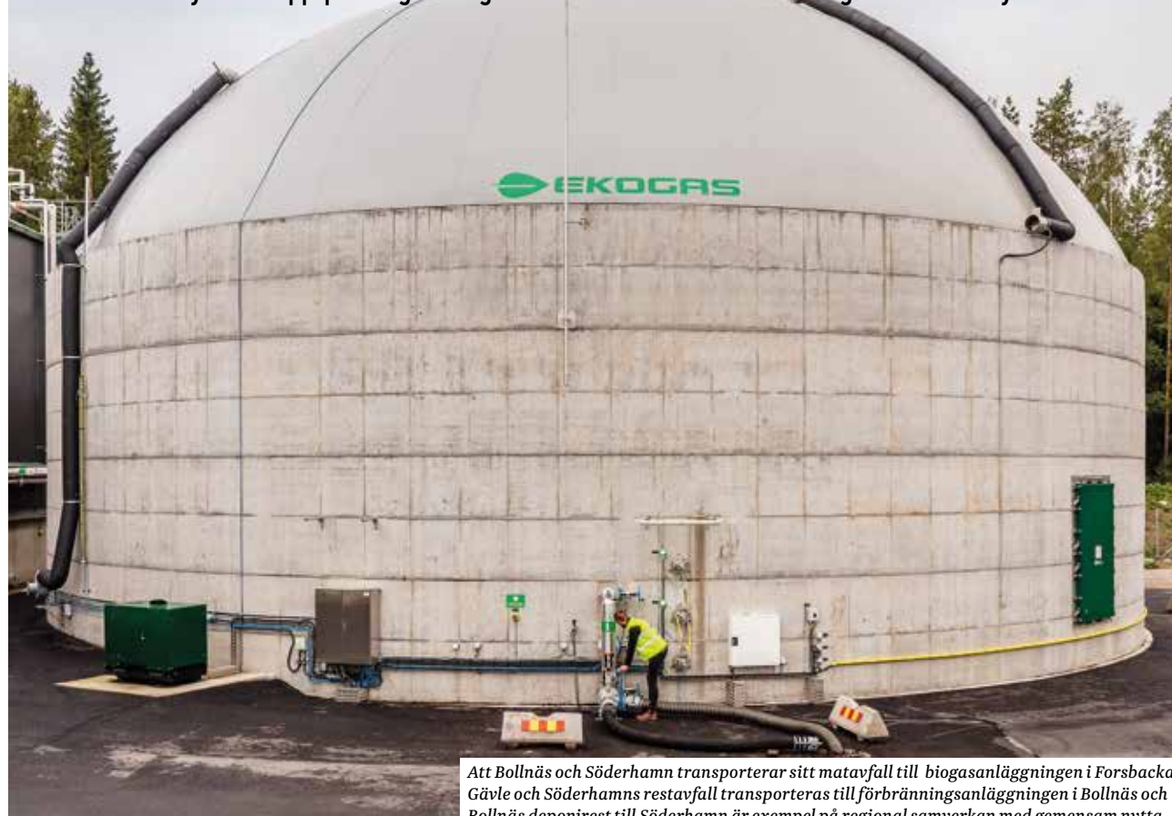
Att Bollnäs och Söderhamn transporterar sitt matavfall till biogasanläggningen i Forsbacka, Gävle och Söderhamns restavfall transporteras till förbränningsanläggningen i Bollnäs och Bollnäs deponirest till Söderhamn är exempel på regional samverkan med gemensam nytta.

Den nya kretsloppsplanen görs i regional samverkan för att vi ska hitta gemensamma nyttor.