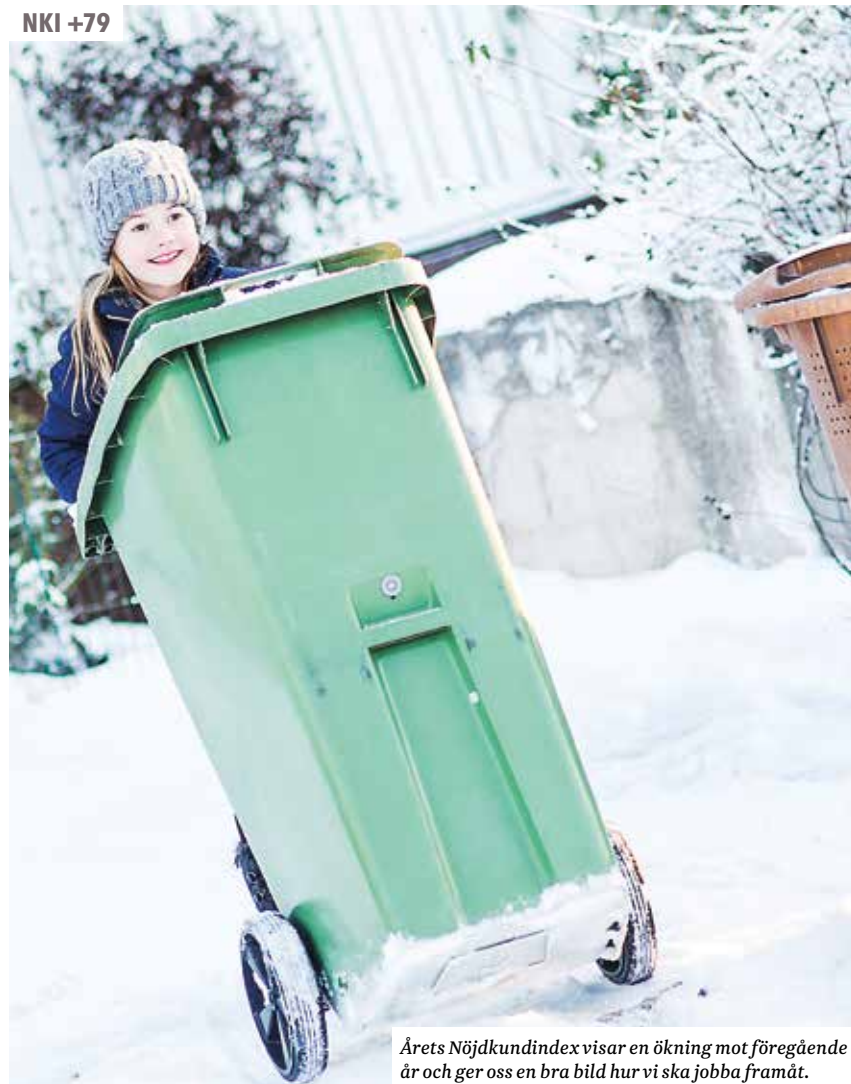
Årets Nöj kundindex visar en ökning mot föregående år och ger oss en bra bild hur vi ska jobba framåt.