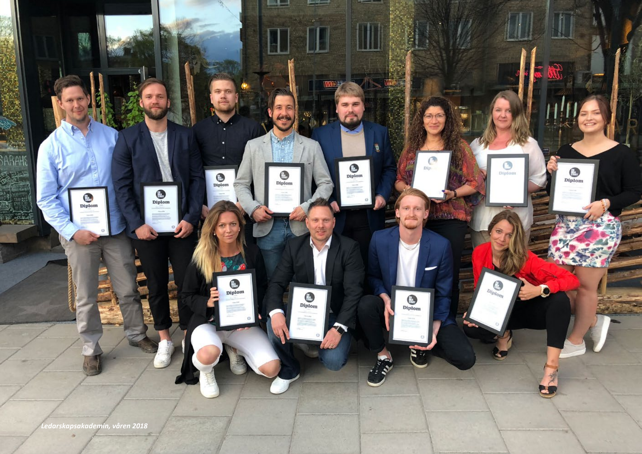
Ledarskapsakademin, våren 2018