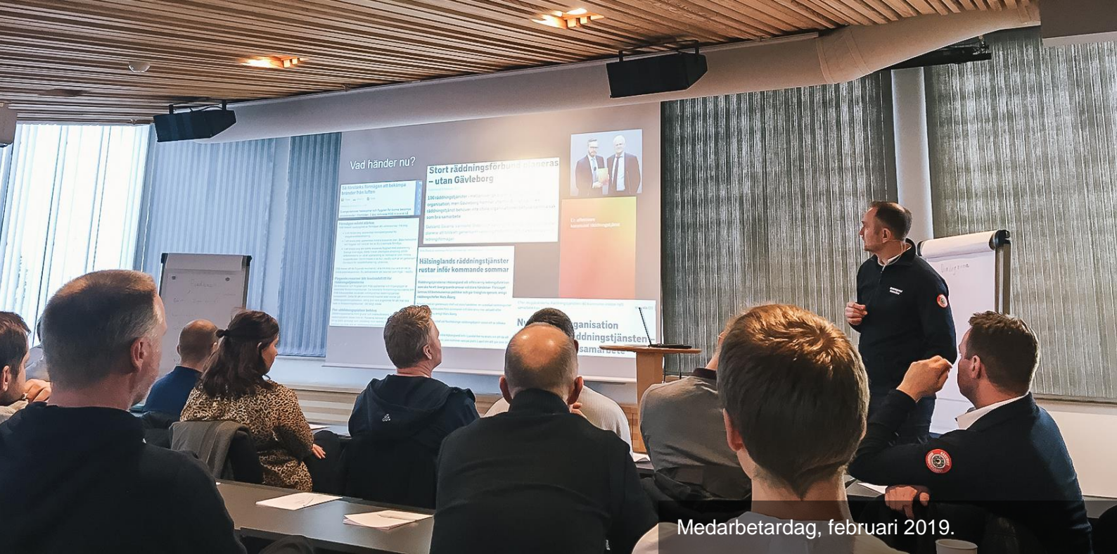
Medarbetardag, februari 2019.