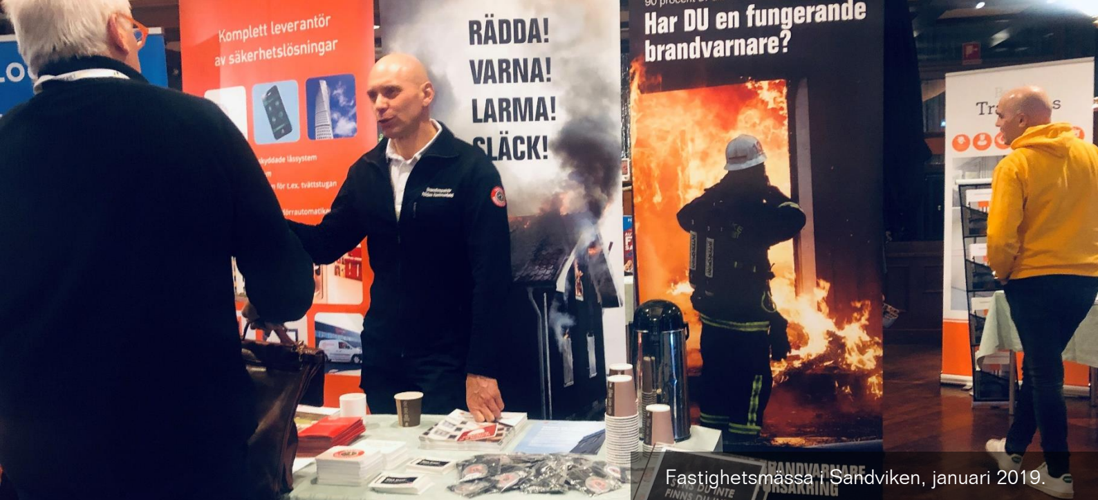
Fastighetsmässan i Sandviken, januari 2019.