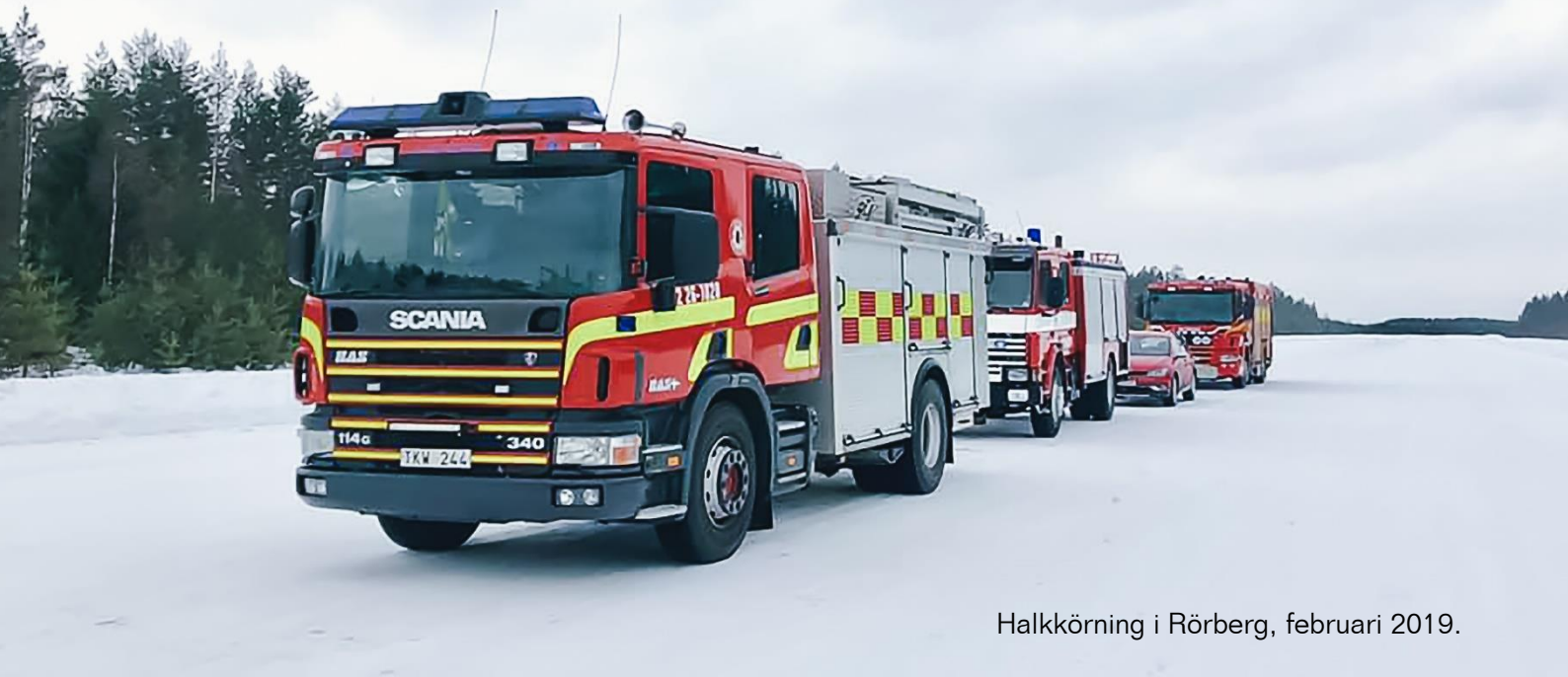
Halkkörning i Rörberg, februari 2019.