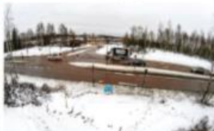
Vid korsningen E16/Nybyrågatan kommer en ny rondell att byggas. Här kommer den gamla signaliserade korsningen att bli en fyrvägskorsning med en gång och cykeltvåra över E16.