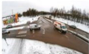
Även vid korsningen E16/Norra Järnvägsgatan blir en ny rondell byggd. Detta här har byggd på tidigare riktlinjer.