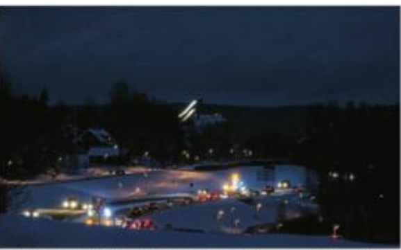
Sveriges Åkeriförbund har anlitat konsultfirman WIP som utfört mätningar på E16 över om Falun. Det visade sig att det fanns fem-tio centimeter skivorna på vägen.

de statliga vägarna och ska säkerställa en trafikantens tryk.