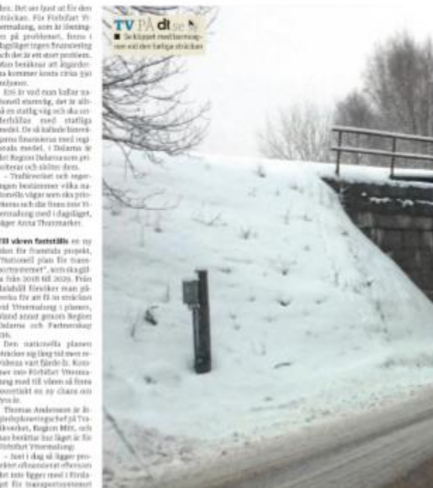
På den trånga vägen blir vädret en riktig utmaning för lastbilar.