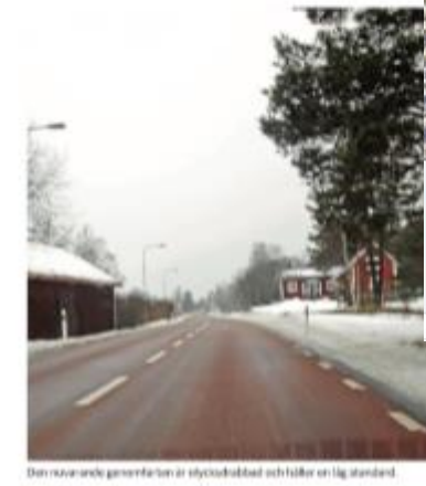
Den svårare och generösa faran är olycksrisk och följer en låg standard.