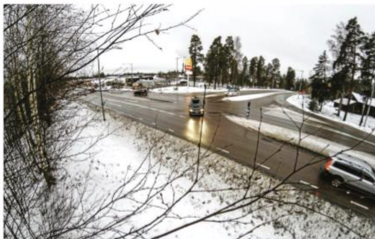
Vid korsningen E16/Regementevägen kommer en rondell att byggas. Trafikverket har gjort att Trafikverket är över ett fjertal sådana ständiga korsningar längs E16.