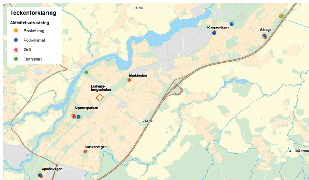
Figur 1 Karta som visar aktivitetsplatser i närområdet. Den röda markeringen visar förslagsställarens önskade läge av en multiarena och ett utegym.

I dagsläget finns bara ett fåtal aktivitetsplatser i Valbo. Kartan nedan visar befintliga lek- och aktivitetsplatser i Valbo. Det finns bl.a. fotbollsplaner, en basketplan och en tennisplan i området. I dagsläget finns det ingen multisportyta i Valbo, som kan erbjuda flera olika typer av aktiviteter på samma plats. Avsaknaden av ett utegym är påtaglig i Valbo, då närmaste utegym är i Forsbacka eller vid Boulognerbadet.