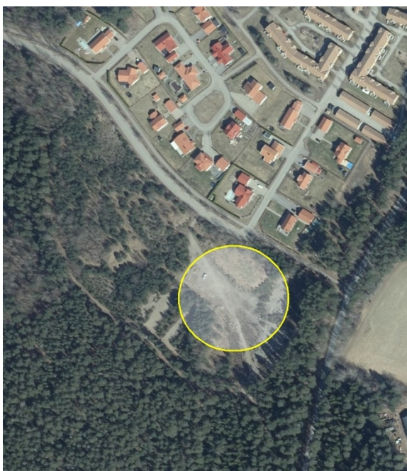
Figur 2: Cirkel markerar tidigare förslag på placering av hundrastgård i Hillegropen.