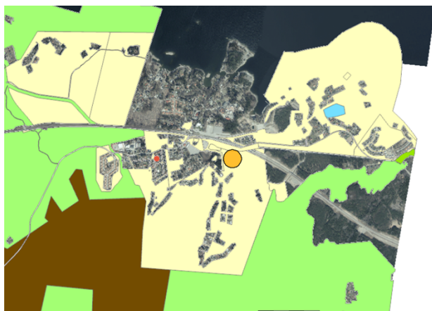
Figur 2 Gävle kommuns markinnehav (ljus gul) Orange område visar läget för den gamla campingen. Rödot illustrerar befintlig lekplats Rönnåsvägen.

Gävle kommun äger marken vid föreslaget läge. Den är planlagd som kvartersmark med användning P-parkering och en del är planlagd som allmän plats, Natur.