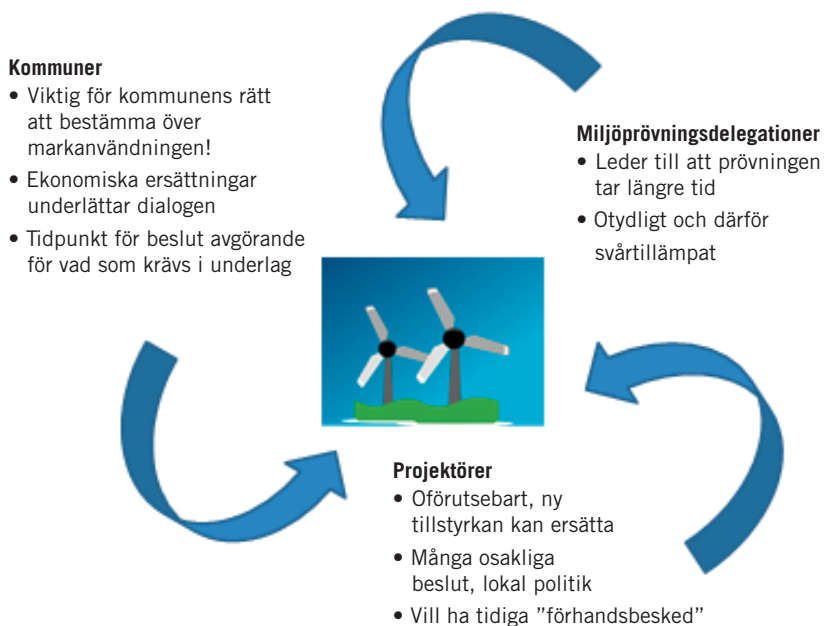
Figur 2. Översikt över de perspektiv och synpunkter respektive aktörsgrupp främst lyft i intervjuerna inom ramen för utvärderingen.