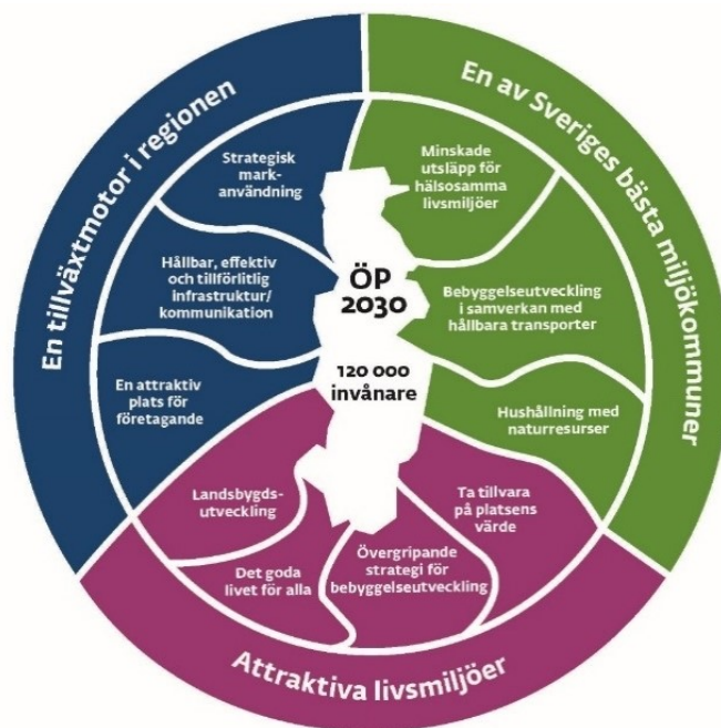
Figur 3. Ekonomiskt, socialt och miljömässigt hållbart Gävle.

I begreppet ingår de tre dimensionerna miljömässig, social och ekonomisk hållbarhet.