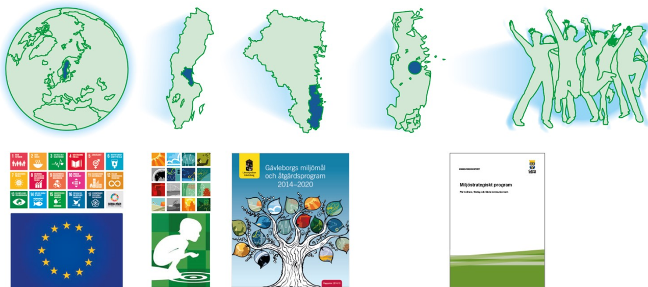
Figur 2. Styrande dokument från globalt till lokalt för Gävles miljöarbete.