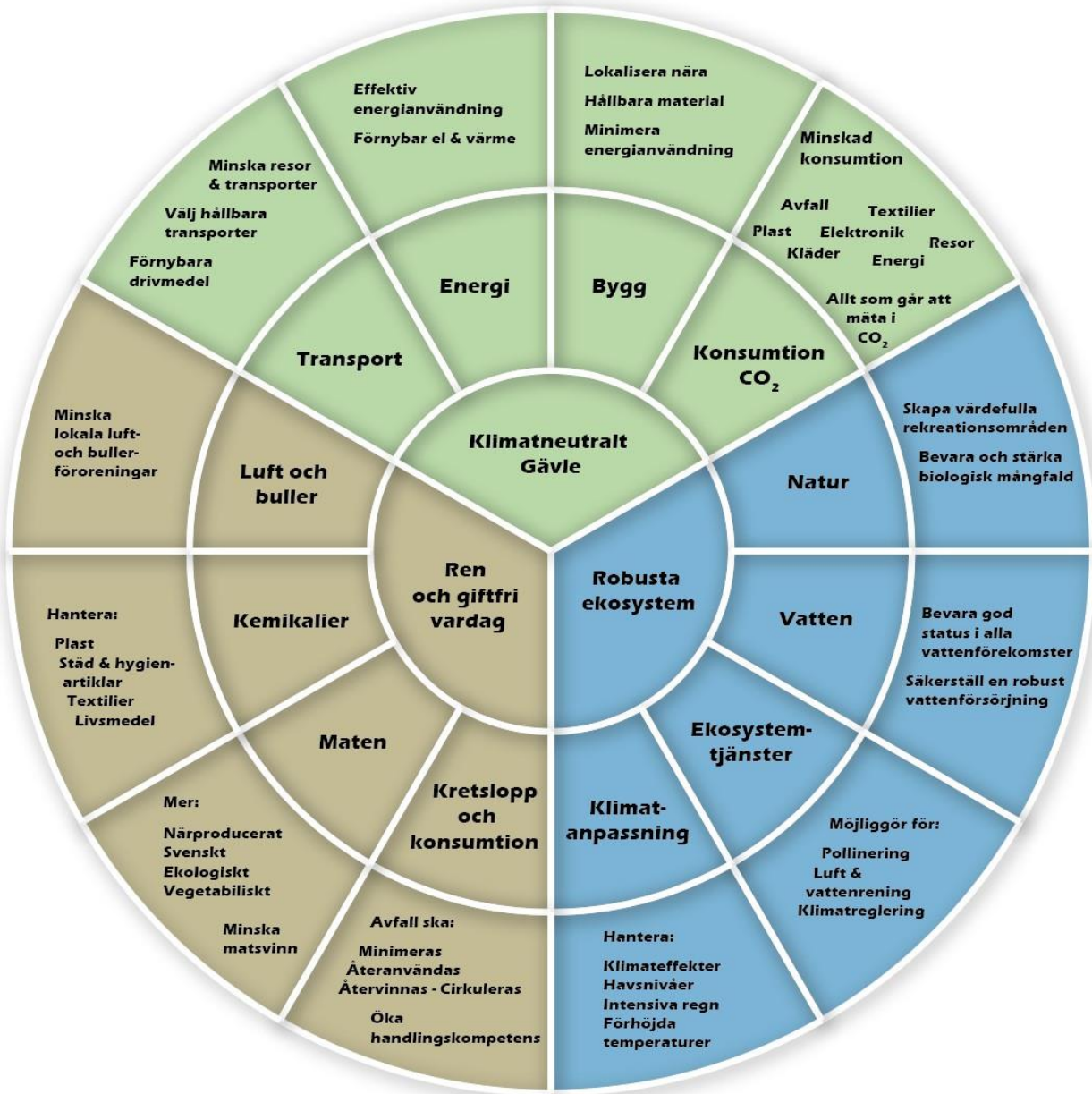
Figur 5: Målområden och vad som ska fokuseras på inom respektive målområde.