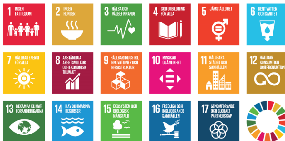
Figur 1. FN:s globala mål för hållbar utveckling

Agenda 2030 antogs 2015 av FN:s generalförsamling och innebär att alla medlemsländer i FN har förbundit sig att arbeta för att uppnå en ekonomiskt, socialt och miljömässigt hållbar värld till år 2030. De 17 målen i Agenda 2030 handlar om att skapa anständiga och hållbara levnadsförhållanden och levnadsvillkor för alla världens människor. Se figur 1.