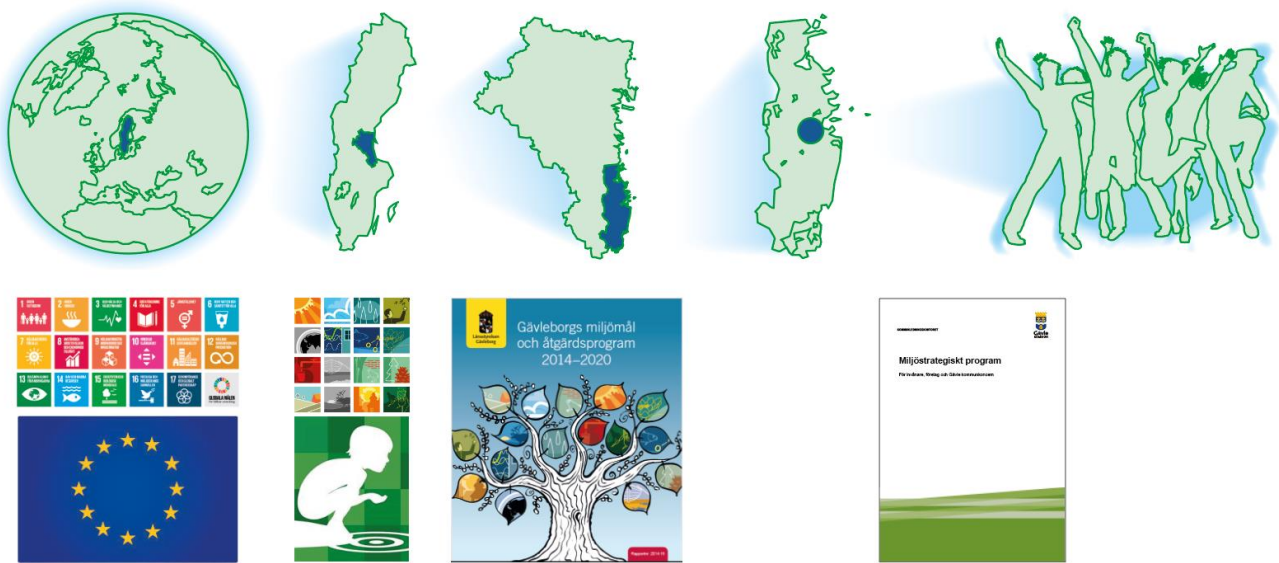
Figur 2. Styrande dokument från globalt till lokalt för Gävles miljöarbete.