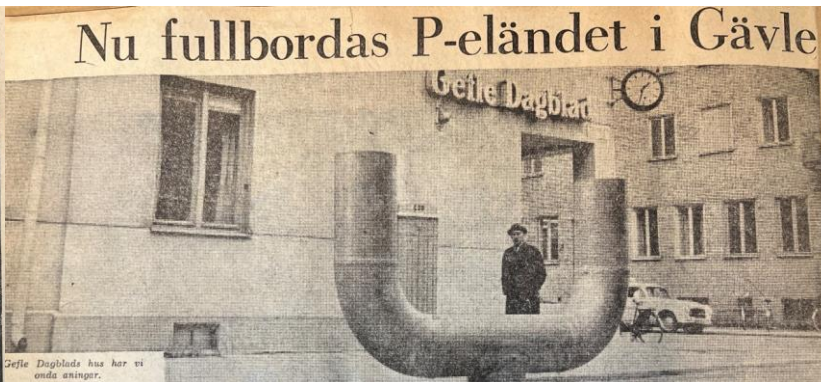
Gefle Dagblads hus har vi onda aningar.

Snart har de sista chanserna försvunnit för bilister att långtidsparkera på gator i Gävles innerstad. Parkeringsautomater har i dagarna satts upp efter flera gator, nu senast vid Slottorget, Stapeltorgsgatan, Kyrkogatan och N. Strandgatan samt runt kvarteret Hästen intill rådhuset. Forts. på sid 13.