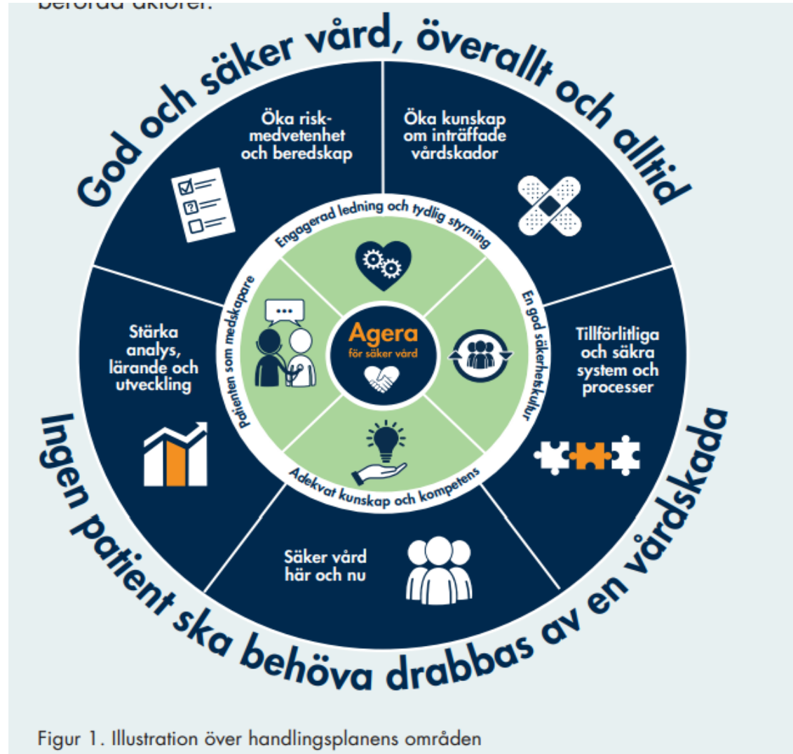
Figur 1. Illustration över handlingsplanens områden