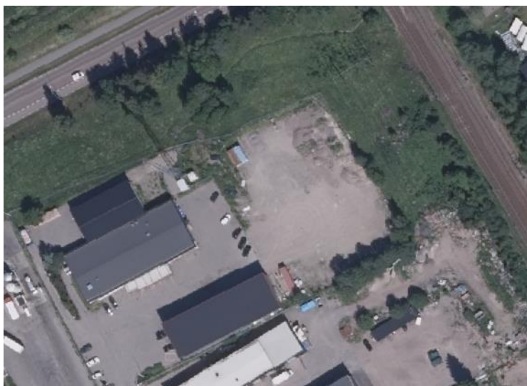
Ortofoto från 2015-07-03

Av ortofoto från 2015 syns två byggnaderna på Hemlingby 56:8 och att Hemlingby 20:1 på aktuellt ställe utgörs av naturmark.