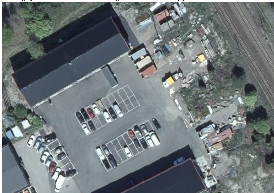
Ortofoto från 2019-05-17

På ortofoto från 2019 syns att även den nya byggnaden är färdig. På Hemlingby 20:1 har diverse lös egendom ställts upp.