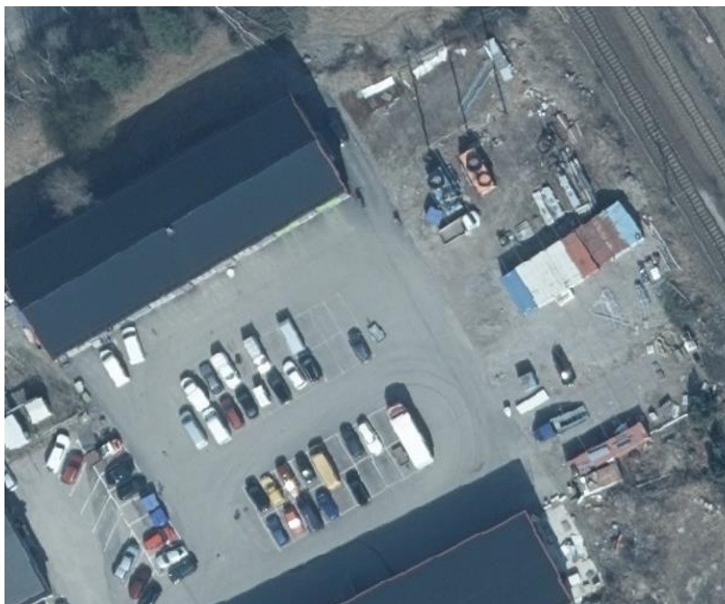
Ortofoto från 2021-04-20

Av ovan redovisade ortofoton syns att någon gång mellan 2019 och 2021 har upplaget utvidgats till den yta det upptar i dagsläget. Den aktuella ytan har mätts in på ortofotot från 2021.