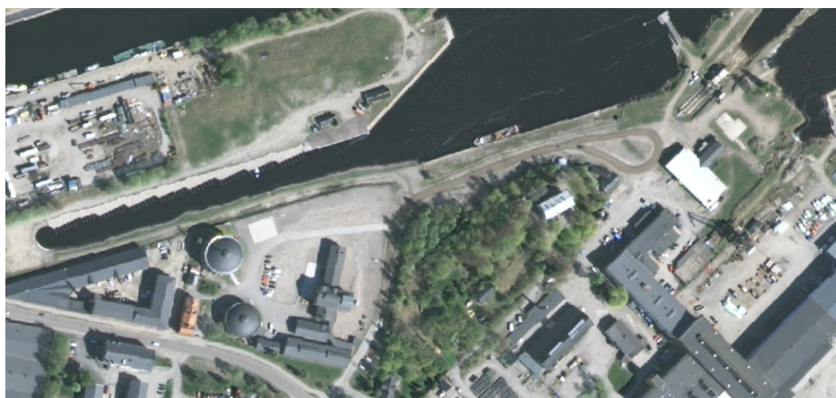
Figur 2 - Från 2013