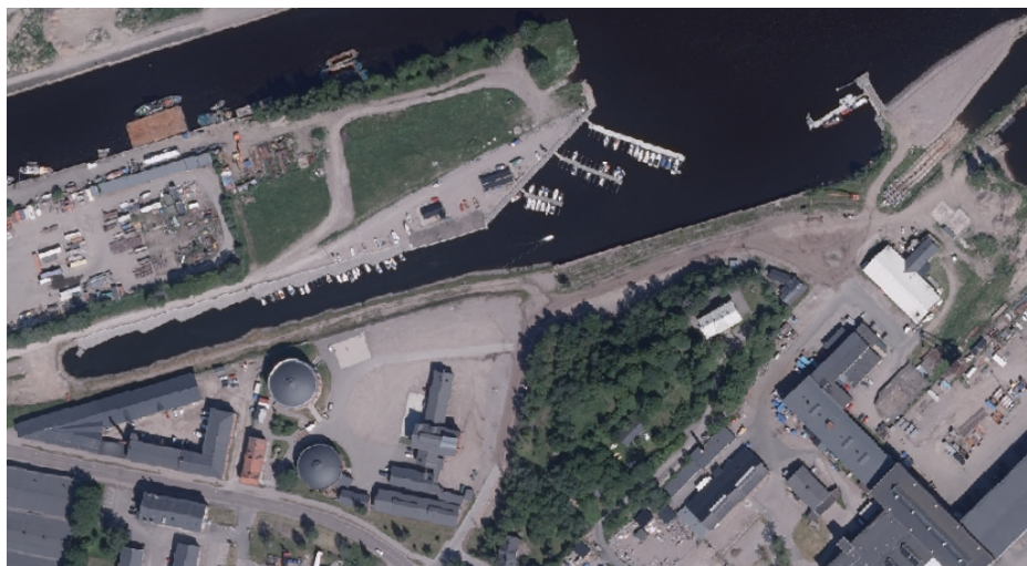
Figur 1 - Från 2015