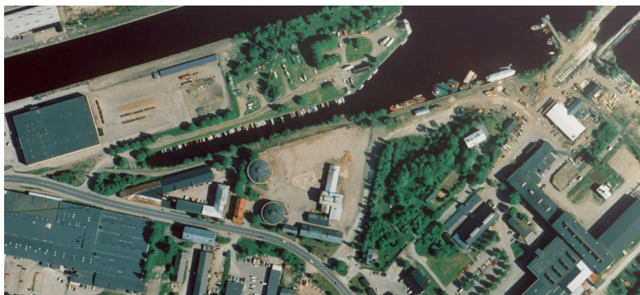
Figur 7 - Från 2001