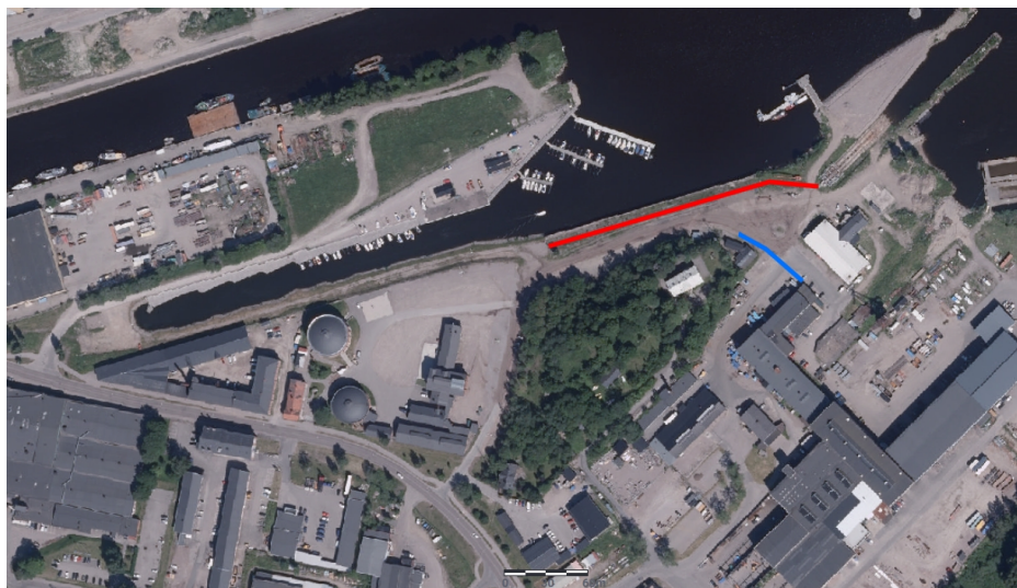
Figur 9 - Markering vart spår finns idag. Även markerat det andra spåret som syntes med blått