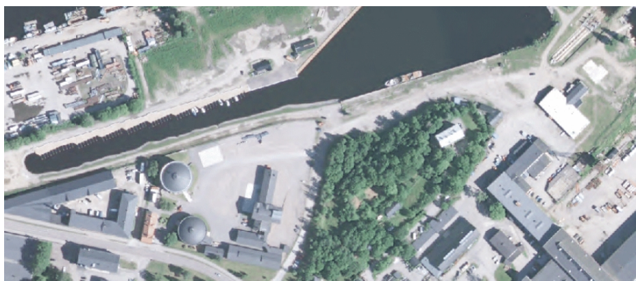
Figur 3 - Från 2012