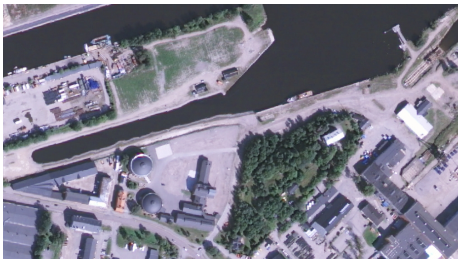
Figur 4 - Från 2011