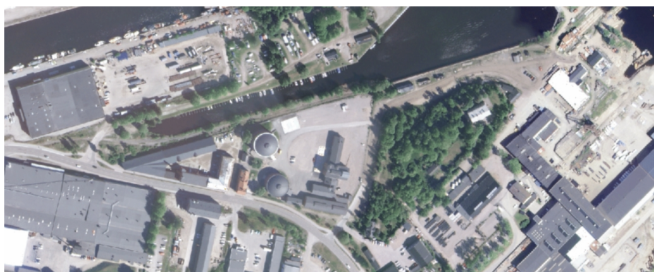
Figur 5 - Från 2009