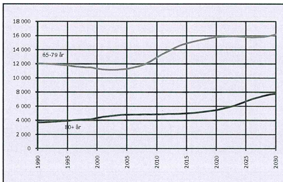
Antal invånare i åldersgrupperna 65-79 år samt 80+ år under perioden 1990-2011 och prognos för åren 2012-2025 (-2030)

Gruppen "Äldre-äldre" (80+ år) ökar först måttligt under de närmsta åren, följt av en period med relativt stora ökningstal. Sammantaget ökar åldersgruppen med drygt 1 800 personer till år 2025 och med ytterligare 1 100 personer till år 2030.