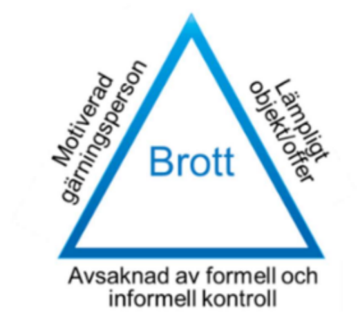
Figur 1. Brottstriangeln i dess grundform.

I brottstriangeln representerar varje enskild sida av triangeln en förutsättning för att brott skall begås. För att brott ska begås ska det finnas; 1. En motiverad gärningsperson, 2. Ett lämpligt objekt/offer, samt 3. Avsaknad av formell och informell kontroll som hindrar att brott begås. När dessa förutsättningar sammanstrålar ökar brottsligheten. Försvagas förutsättningarna minskar brottsligheten. För att förebygga brott skall således en, eller flera, av dessa förutsättningar angripas.